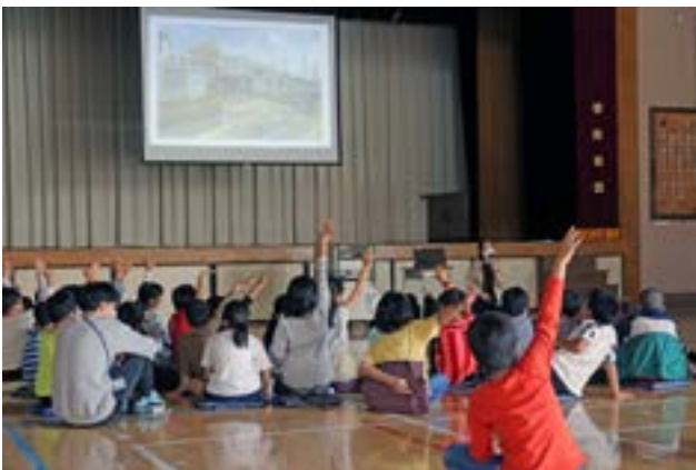
「世田谷の移り変わり」解説