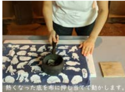
「昔の暮らし－アイロン－」