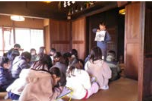
社会科見学（解説）風景