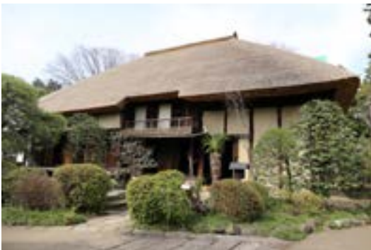
世田谷代官屋敷主屋

※5クラス以上の場合にはご相談ください。時間を分けるなどの対応をお願いすることがあります。