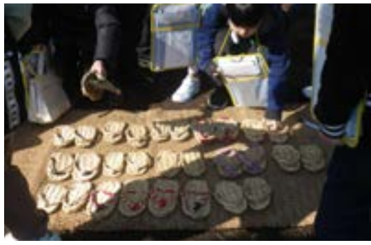
社会科見学（体験）風景