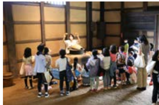
社会科見学：代官屋敷主屋土間解説