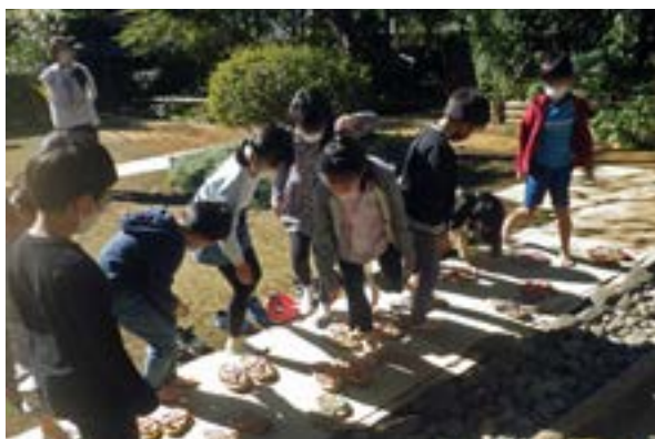
ワラについての学習。ワラ草履を履いて、ワラの特性などについて学ぶ。