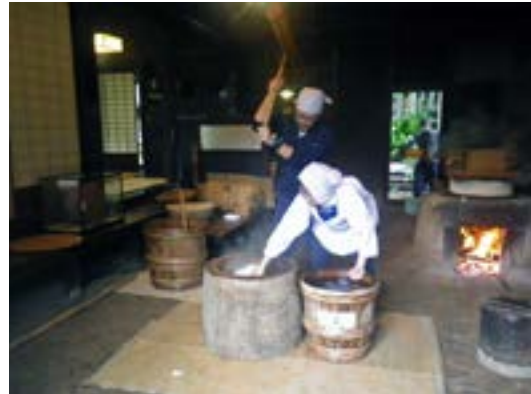
「昔の暮らし－世田谷の月見行事－」