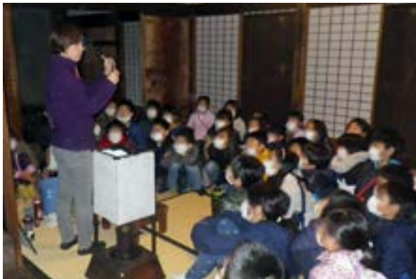
「火」をテーマにした学習。灯火具を使った昔の明るさ体験の様子。