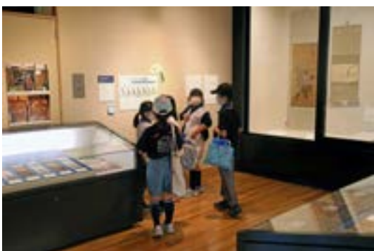
社会科見学：資料館展示室自由見学