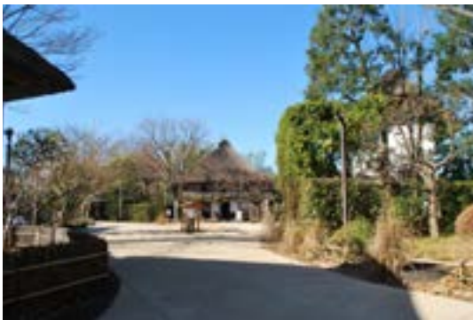
次大夫堀公園民家園