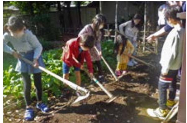
農家の仕事についての学習。畑の道具（クワ）を使い、その特徴などについて学ぶ。