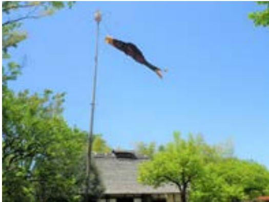
「昔の暮らし－世田谷の五月節句－」