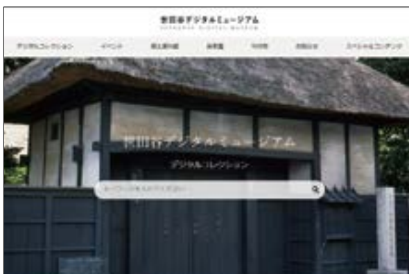
世田谷デジタルミュージアム

世田谷デジタルミュージアム ( https://setagayadigitalmuseum.jp/ ) では、区内の文化財や関連資料をデジタル化して保存し、気軽に文化財へアクセスできるウェブサイトを公開しています。「スペシャルコンテンツ」内には、「世田谷区の歴史」、「ジュニア講座」など、授業や家庭学習で活用いただけるコンテンツもご用意しています。