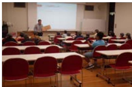
社会科見学：昔の道具解説